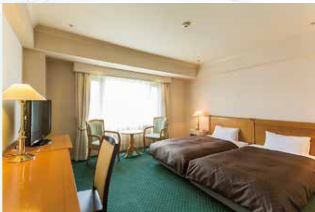
シングルルームもしくはツインルーム

新型コロナウイルスワクチン接種をされるお客様および付き添いの方を対象とした宿泊プランをご用意いたしました。