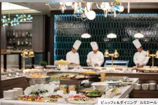
ビュッフェ&ダイニング ルミエール