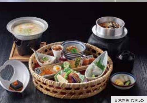
日本料理 むさしの