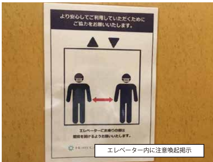
エレベーター内に注意喚起掲示