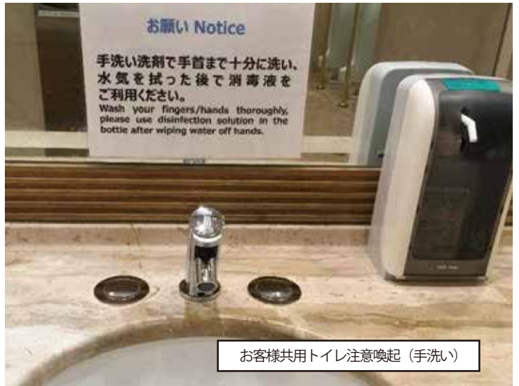
お客様共用トイレ注意喚起(手洗い)