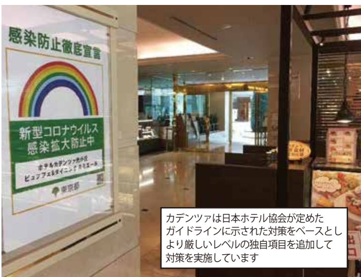
カデンツァは日本ホテル協会が定めた ガイドラインに示された対策をベースとし より厳しいレベルの独自項目を追加して 対策を実施しています