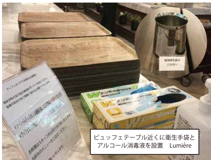
ビュッフェテーブル近くに衛生手袋とアルコール消毒液を設置 Lumière