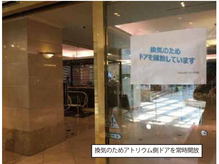
換気のためアトリウム側ドアを常時開放