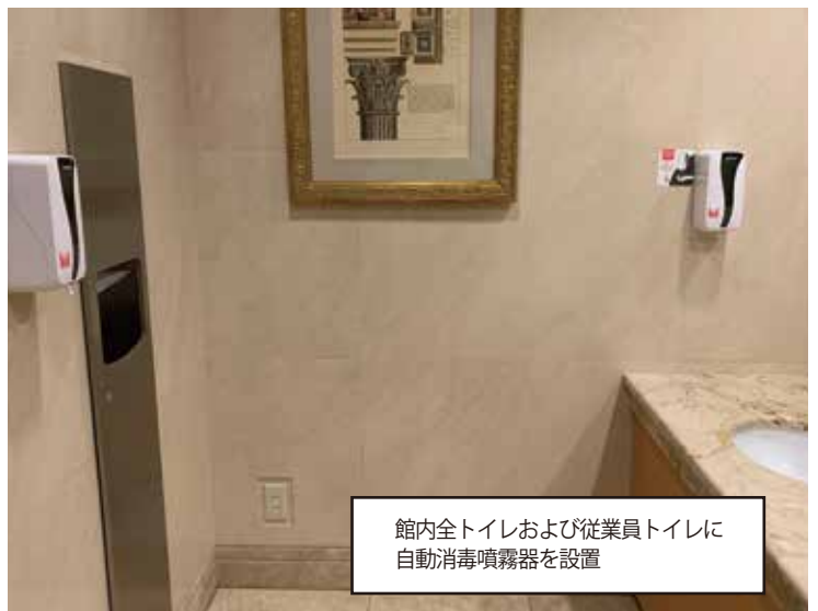
館内全トイレおよび従業員トイレに 自動消毒噴霧器を設置