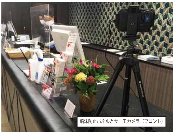
飛沫防止パネルとサーモカメラ（フロント）