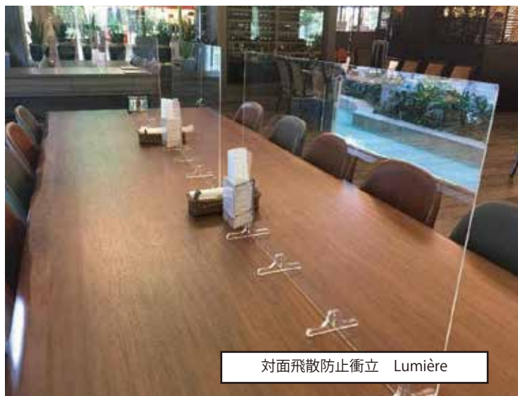
対面飛散防止衝立 Lumière