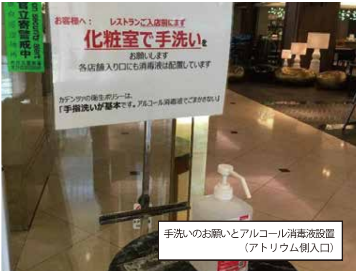
手洗いのお願いとアルコール消毒液設置 (アトリウム側入口)