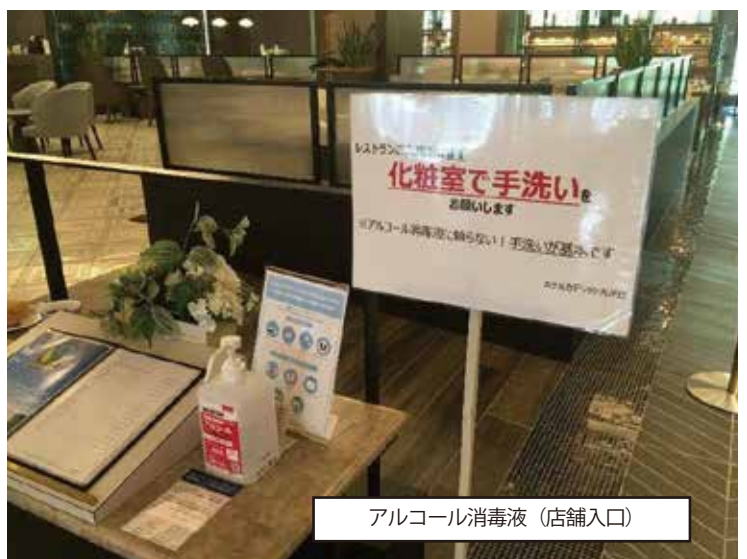
アルコール消毒液(店舗入口)