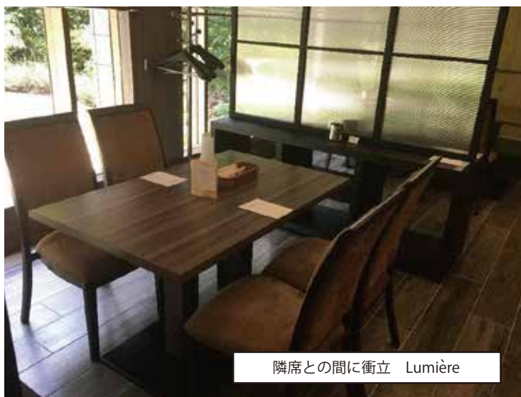
隣席との間に衝立 Lumière