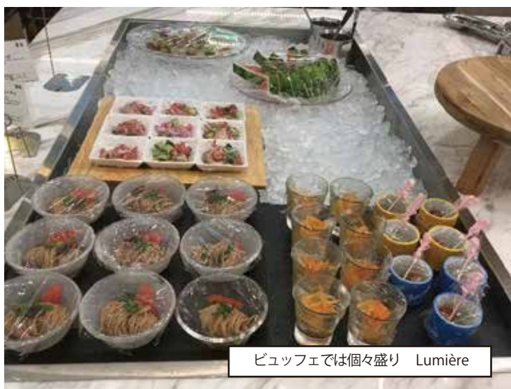
ビュッフェでは個々盛り Lumière