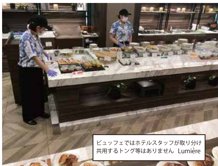
ビュッフェではホテルスタッフが取り分け共用するトング等はありません Lumière