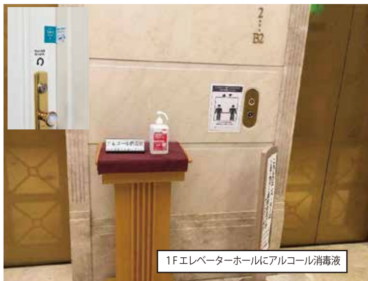
1Fエレベーターホールにアルコール消毒液