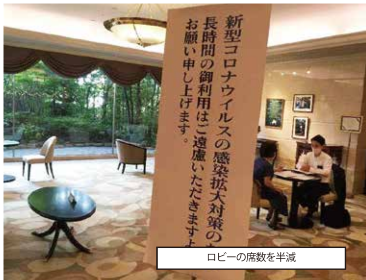
ロビーの席数を半減