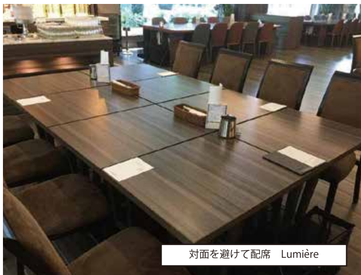
対面を避けて配席 Lumière