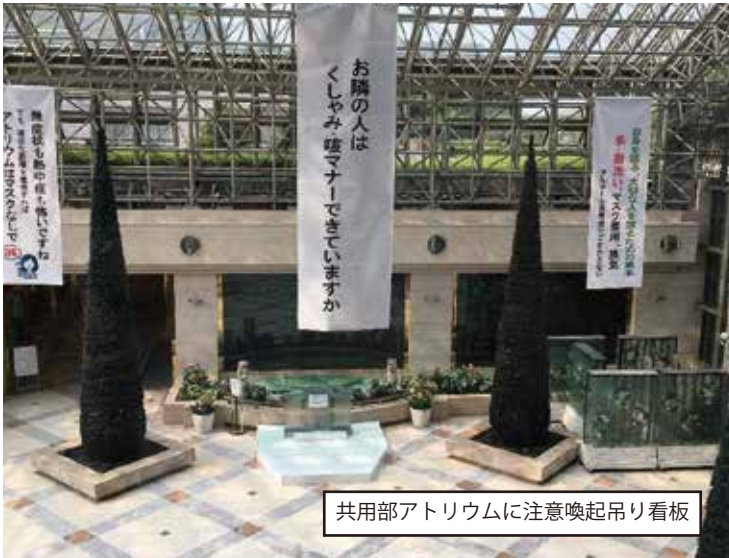
共用部アトリウムに注意喚起吊り看板