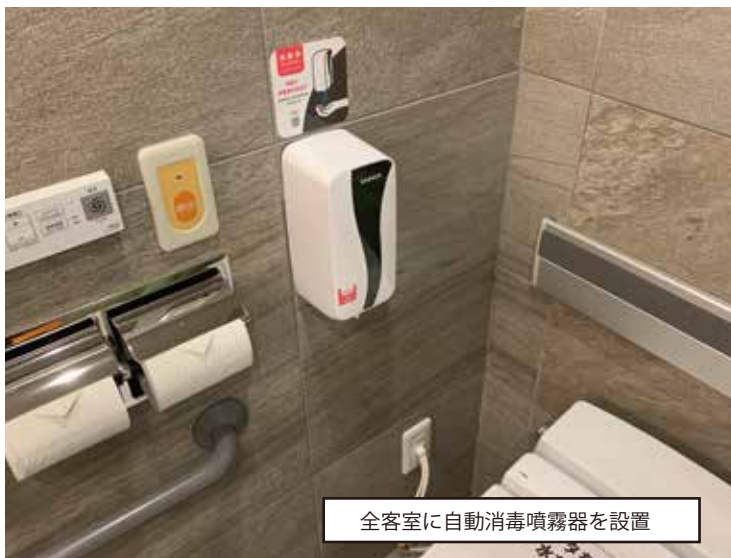
全客室に自動消毒噴霧器を設置