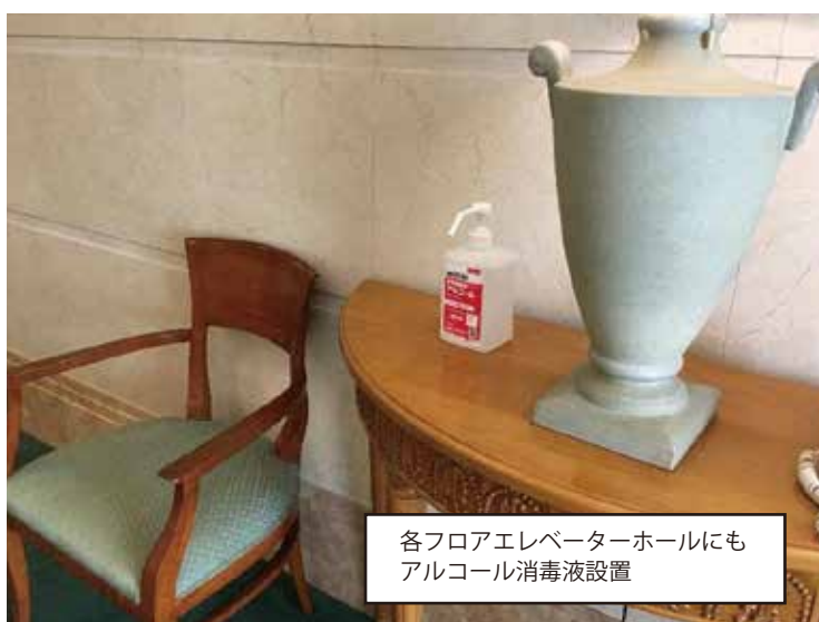
各フロアエレベーターホールにも アルコール消毒液設置