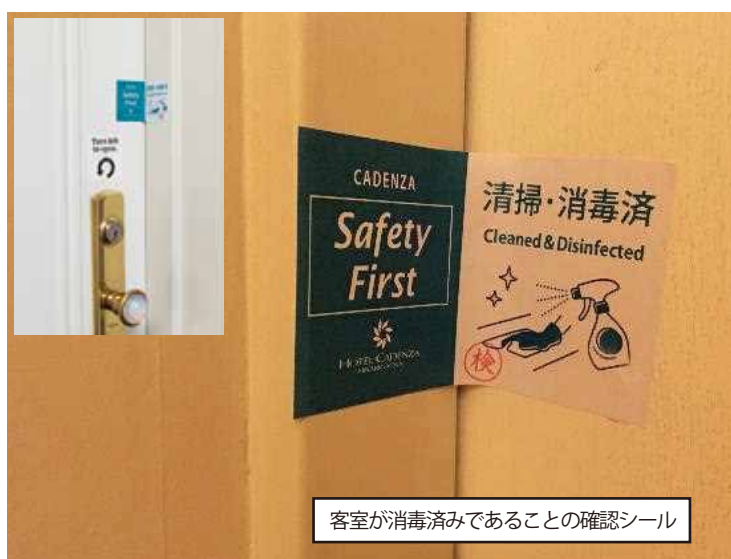
客室が消毒済みであることの確認シール