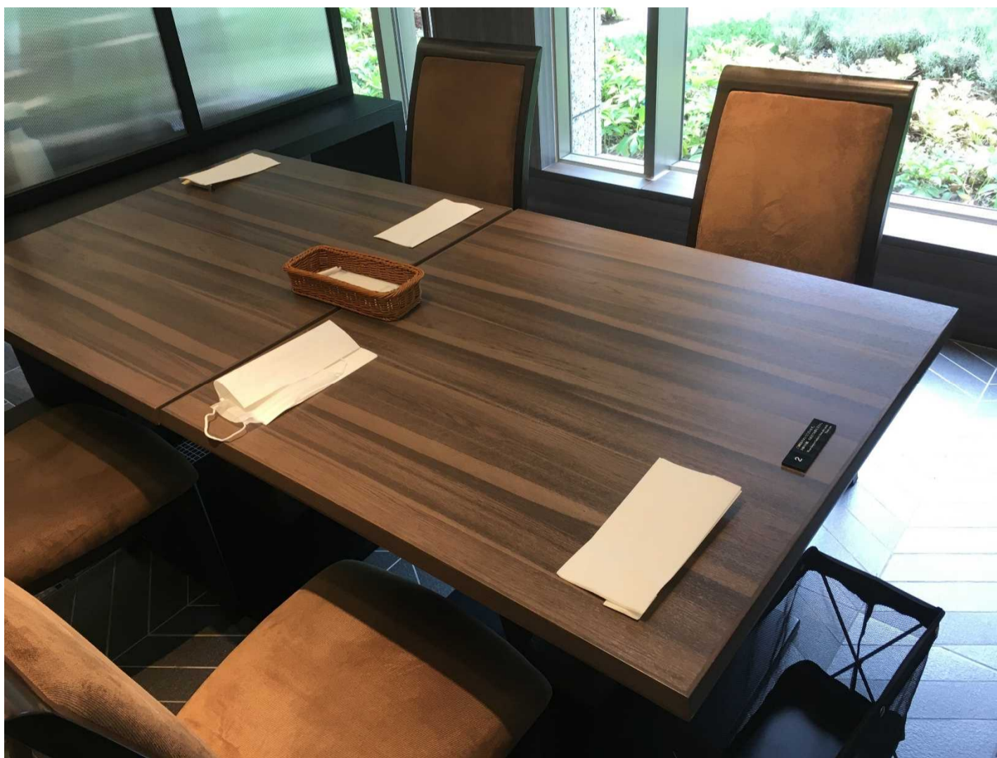
対面にならないよう配席