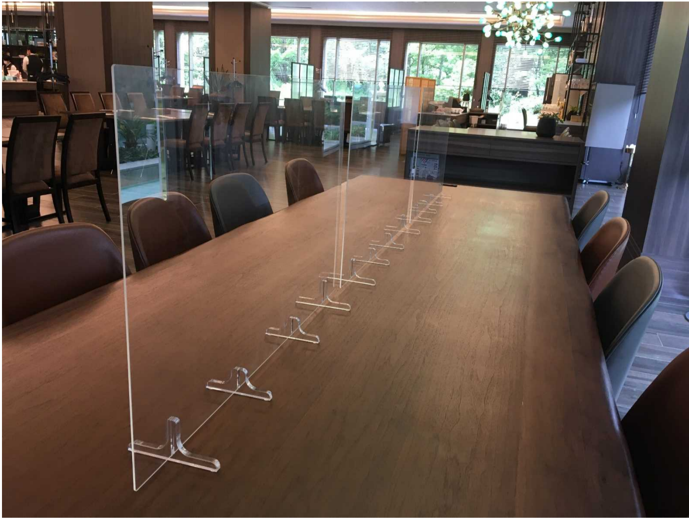
Lumière 店舗内ビッグテーブルにもアクリル板を設置