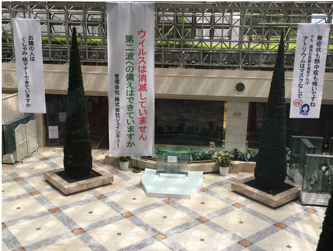
アトリウム側エントランスに注意喚起