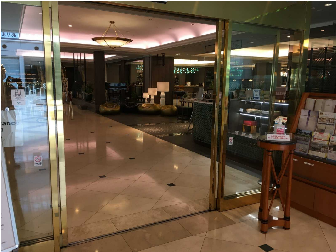
Lumière そばのドアは開放し換気を促進