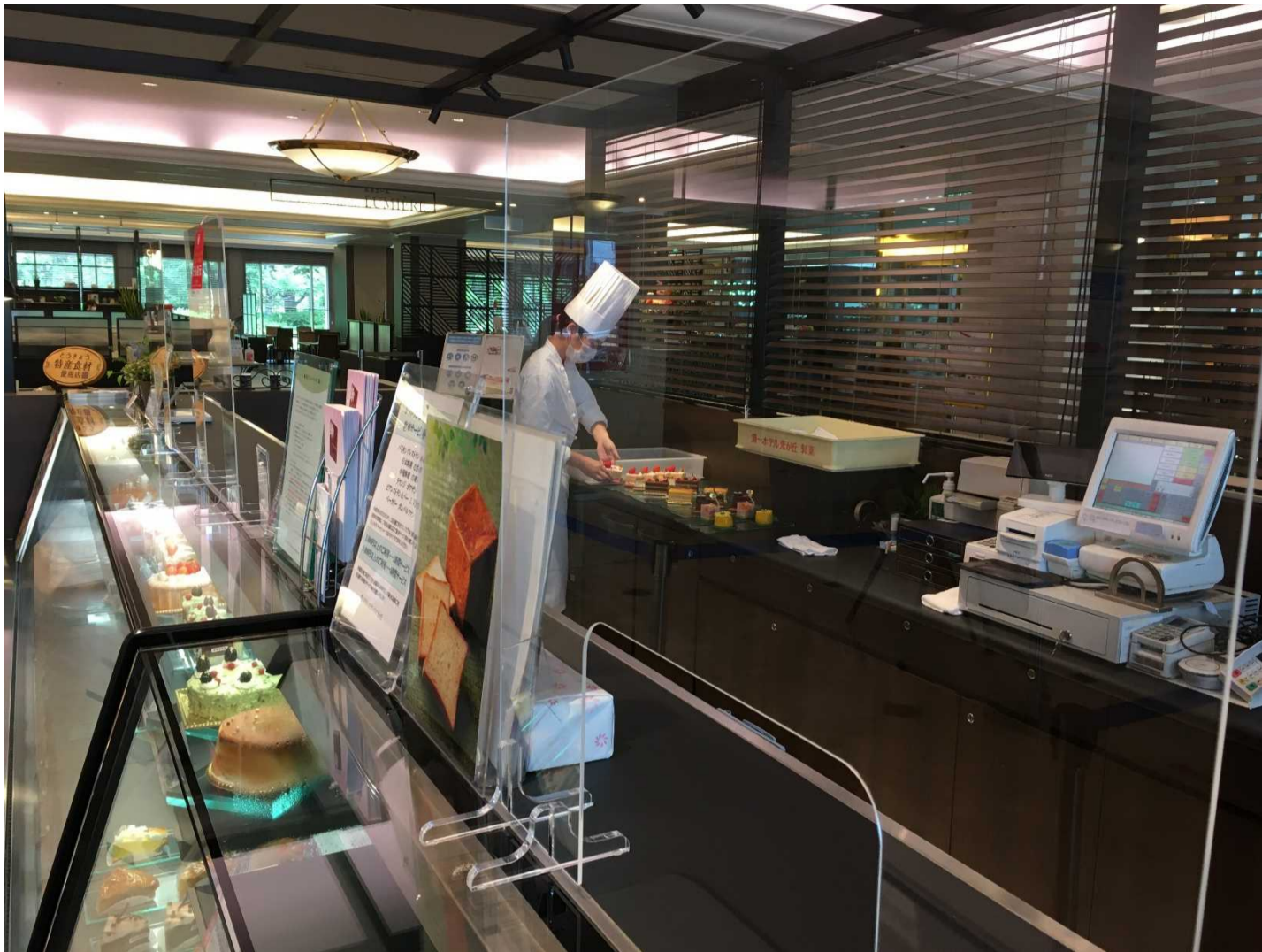
BONPERFUN 対面店舗にアクリル板を設置