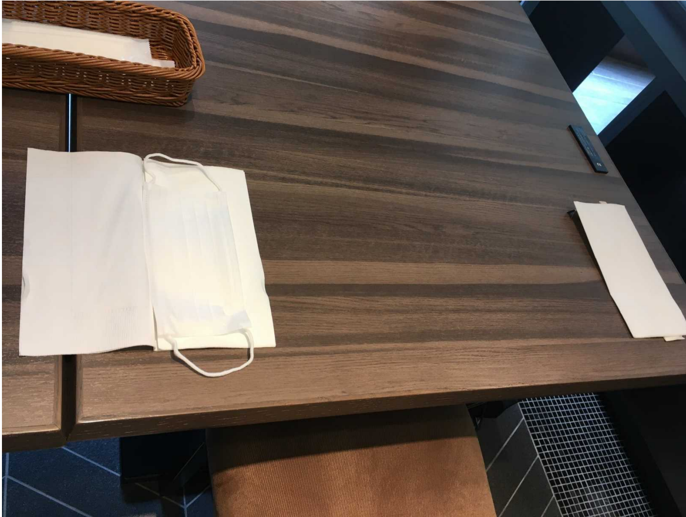
マスクを置くための紙ナプキンを置きました（テーブルに直置きしない）。