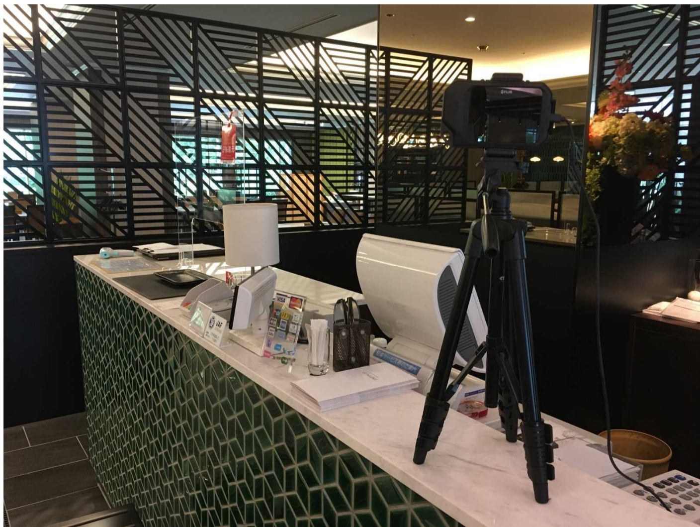
Lumière 店舗入り口にサーモカメラを設置