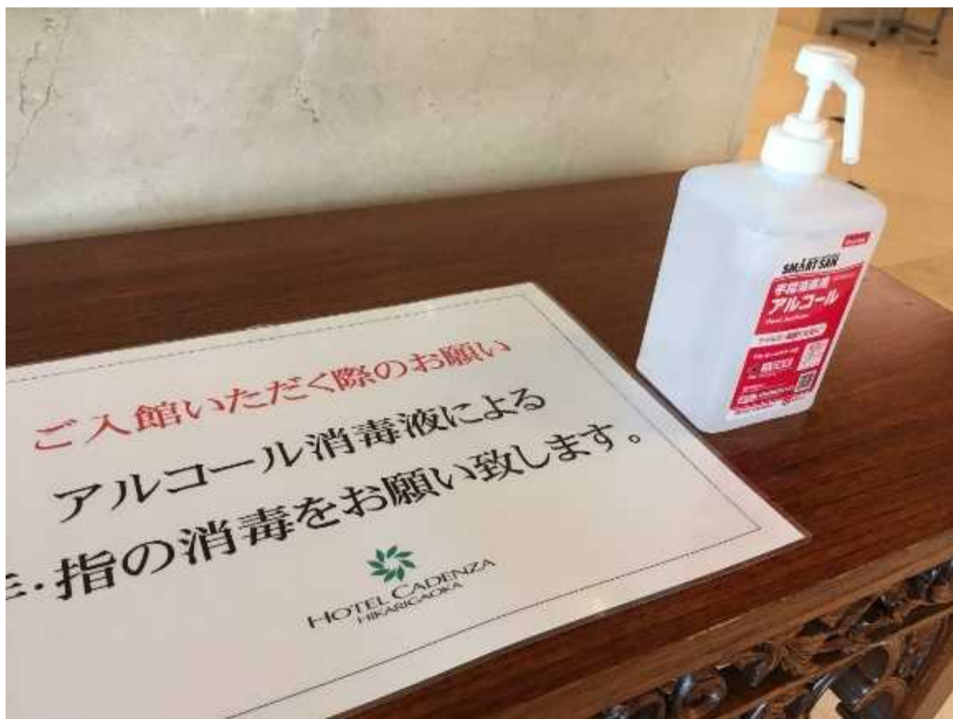
ホテルエントランスと店舗入り口にアルコール消毒液を設置