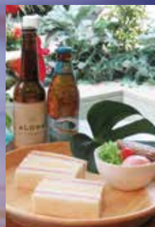
ハワイアンフードイメージ